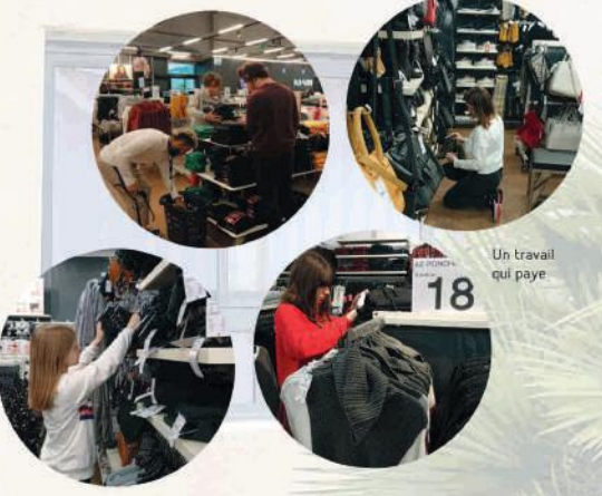
Un travail qui paye