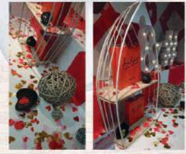
La St Valentin en salle des ventes pour les CAP 2

Les élèves des classes de Première et de Terminale Bac Pro Commerce ont désormais la possibilité d'effectuer une ou plusieurs périodes de formation en entreprise sur la ville de Santander, à partir du 31 mai 2019 et ce pour une durée de 2 ans.