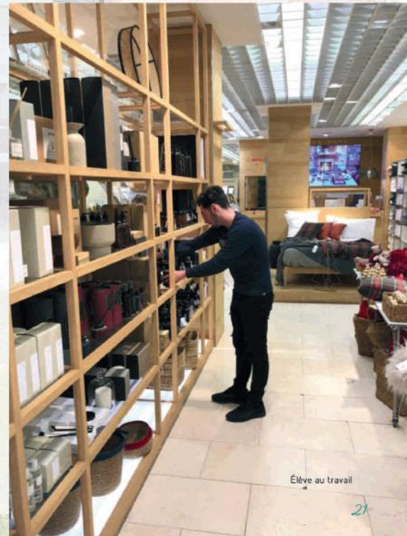
Élève au travail

En ce qui concerne l'aspect logistique, ces mêmes élèves sont logés dans des familles qui leur font découvrir la gastronomie, mais également les différents aspects culturels de cette belle région d'Espagne. De ce fait, comme ils sont en immersion complète durant cette période, ils peuvent progresser plus efficacement en espagnol.