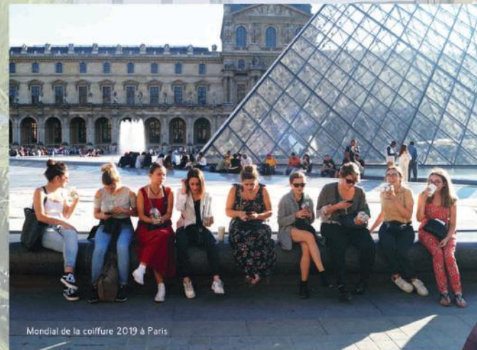
Mondial de la coiffure 2019 à Paris