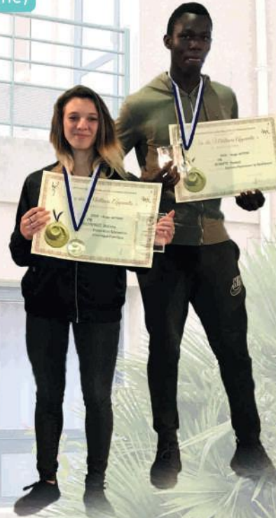
Concours MAF Meilleur Apprenti de France