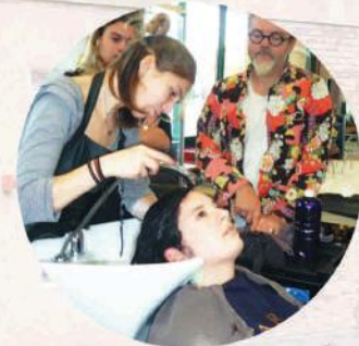
Découverte des produits capillaires végétaux