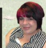
Réalisation concours MAF Meilleur Apprenti de France par Samantha