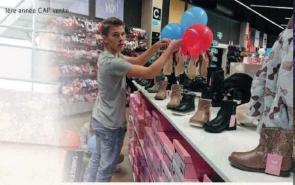
1ère année CAP vente