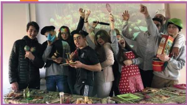
MasterTapas avec les élèves de 3ème Prépa Pro