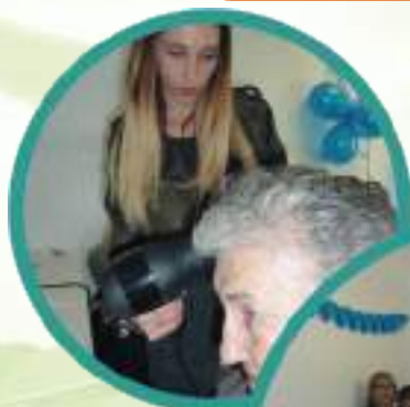
Semaine Bleue chez les MC Coiffure