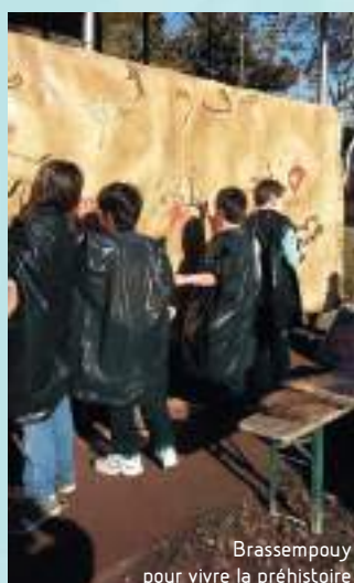
Brassempouy pour vivre la préhistoire

Jeunesse Musicale de France (JMF) : Spectacles musicaux Sorties cinéma Voyages Chorales