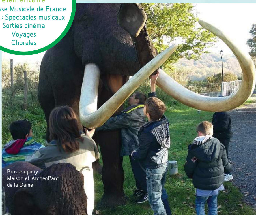
Brassempouy Maison et ArchéoParc de la Dame