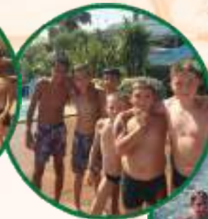
Les internes à Atlantic Park