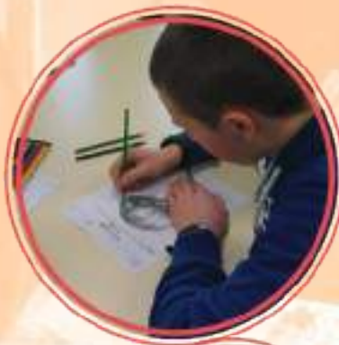
Les 3èmes découvrent le lycée Pro