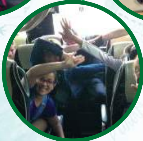
Voyage des CM1, CM2 et 6ème à Donostia-San Sebastian.