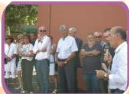
Inauguration du fronton entièrement refait à neuf