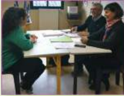
L'association EGEE coach les élèves de Terminale BAC Pro