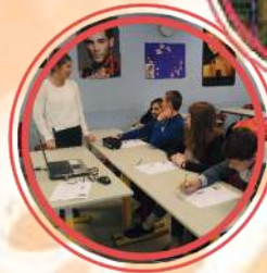
Joies de la glisse et Atelier informatique pour les internes

Dans le cadre des activités du mercredi après-midi, les élèves peuvent s'initier à la pâtisserie, guidés par la Chef de cuisine à l'occasion d'ateliers cuisine.