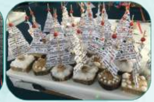
Marché de Noël 2017