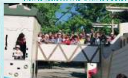
Spectacle de la balle rouge

Projets culturels en maternelle et élémentaire