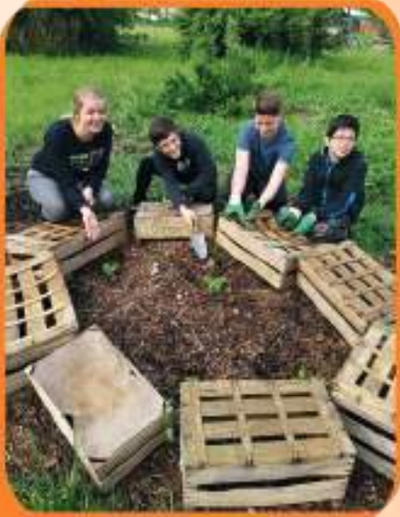
Découverte du développement durable en SEGPA