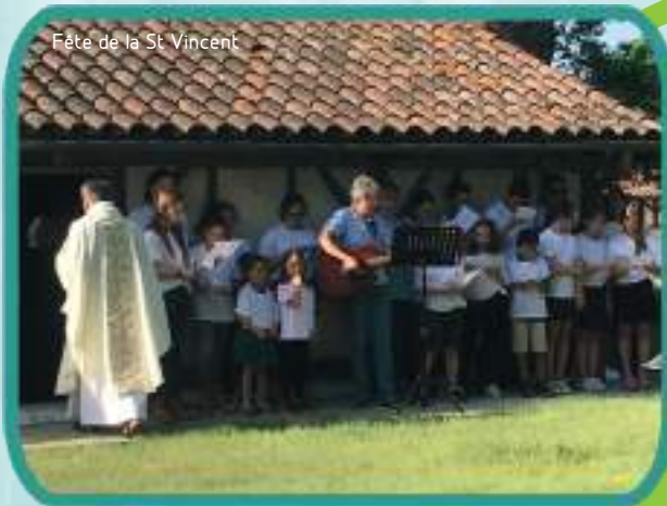
Fête de la St Vincent

Chaque année, nos élèves célèbrent la rentrée de l'enseignement Catholique avec un temps fort :