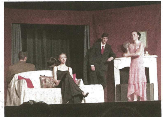
La troupe existe depuis sept ans et « stupéfie le public à chaque représentation ».

Le handball club saint-paulois organise une représentation théâtrale vendredi, à 20 h 30, à la salle Félix-Arnaudin.