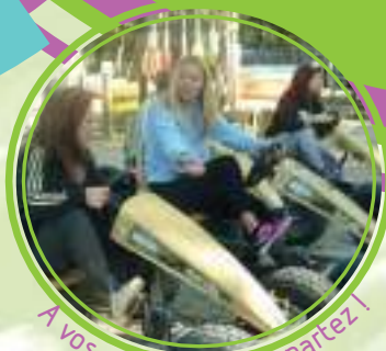
A vos marques, prêt, partez !

Le but : favoriser les échanges, l'esprit d'équipe, le dépassement de soi et l'acceptation de la défaite au travers de défis sportifs.