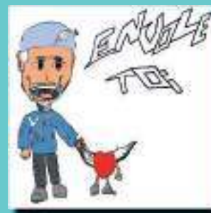
Mascotte (illustrant St Vincent de Paul) dessinée par les élèves.