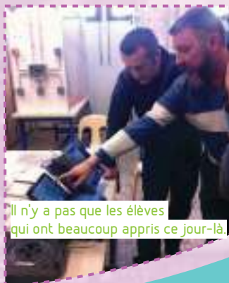
Il n'y a pas que les élèves qui ont beaucoup appris ce jour-là