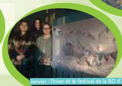
Janvier : l'hiver et le festival de la BD d'Angoulême