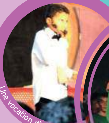
Une vocation d'artiste