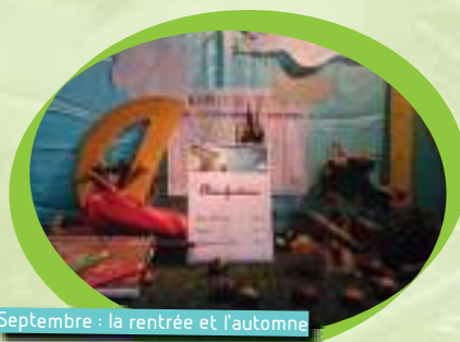
Septembre : la rentrée et l'automne